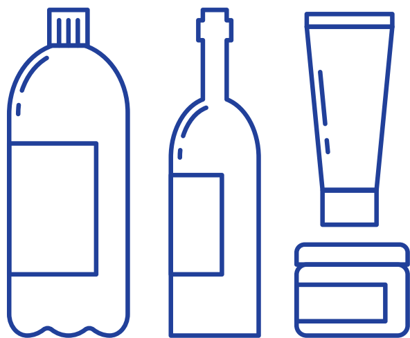
PIÙ GRANDE DI 100 ML